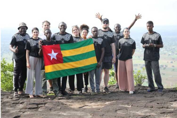
GRUPPE SOMMER 2025