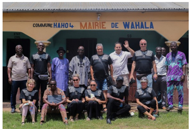
GRUPPE HERBST 2025